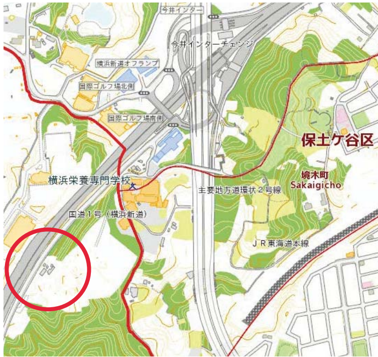
戸塚区品濃町最終処分場 所在地 横浜市戸塚区品濃町1622番地