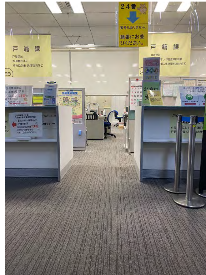
③-2 スイングドア (間口 1,000 mm)