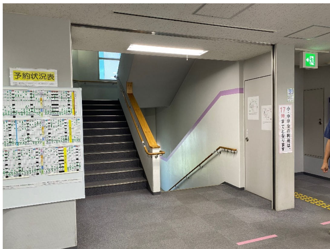
3階 地区センター 受付階