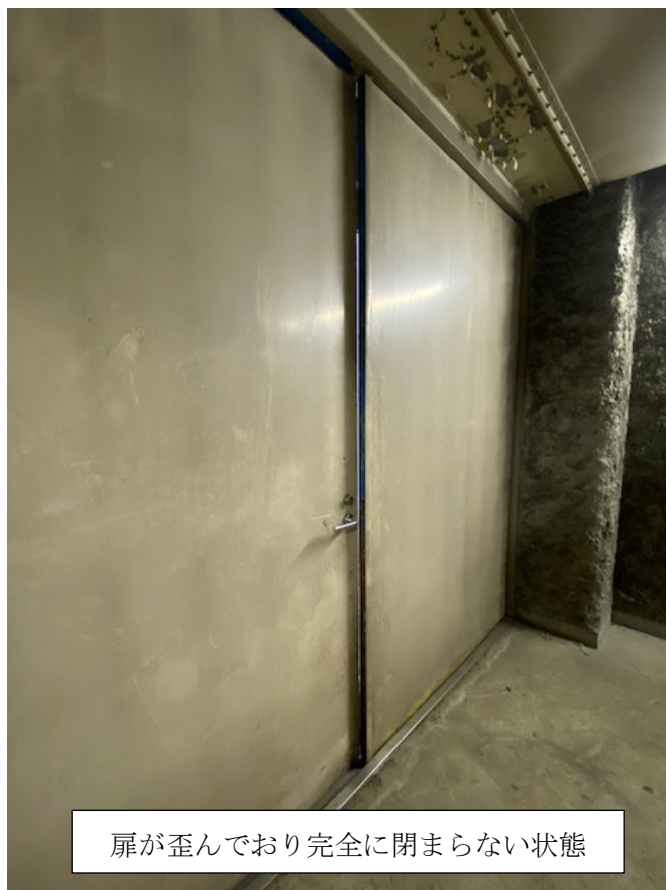
扉が歪んでおり完全に閉まらない状態