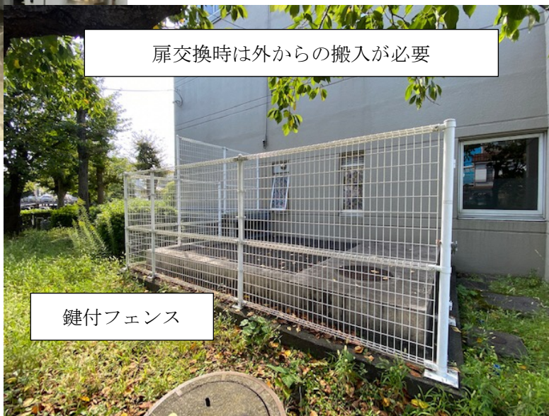
扉交換時は外からの搬入が必要