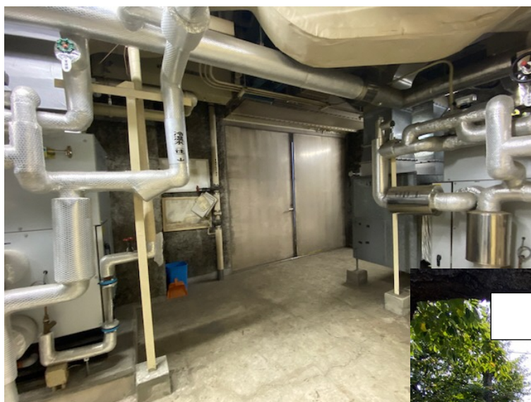
機械室内部から見た図