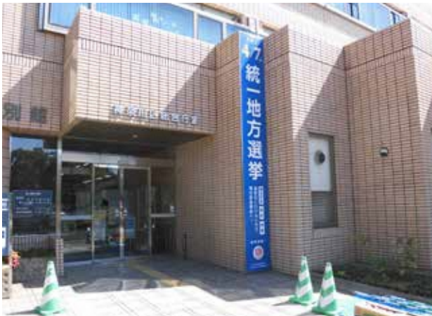
003*神奈川区役所（反町公園側）