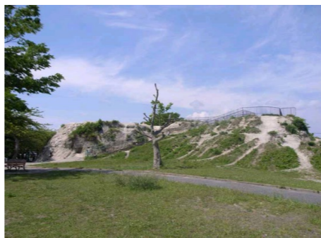
遊び場(室ノ木地区)