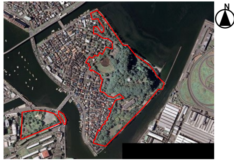
横浜市環境創造局第11次緑地環境診断調査(令和元年度) 航空写真データ

敷地は金沢湾に面した横浜市南端部の干潟に囲まれた埋立地の中に位置している。公園の大部分を占める野島山は広葉樹を中心とした樹林に覆われた自然丘陵地形である。残りの平坦地は、海岸沿いは主としてクロマツ植林地、それ以外はケヤキ・プラタナス・マテバシイといった緑化木による植栽林や草地となっている。