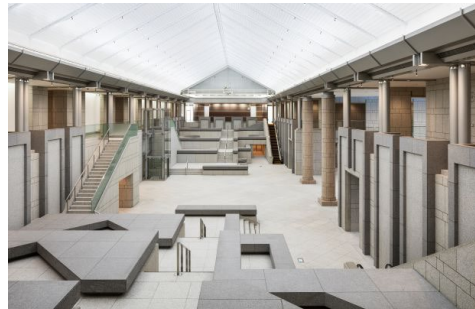
グランドギャラリー