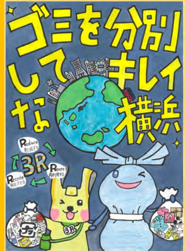
令和7年度 大賞作品(中学生の部)

子どもらしい自由な発想や創造力で環境にやさしい行動を市民の皆様に訴えるポスターを描いてもらい、横浜市の環境施策の広報啓発で活用すること、また、ポスター制作を各学校で授業に取り入れ、夏休みの課題等とすることで、児童・生徒のみなさんがこれらのテーマに向き合い、環境問題に関する基礎的な知識を身につけるとともに、その解決に必要な行動を自らが考え、実践するきっかけとすることを目的としています。