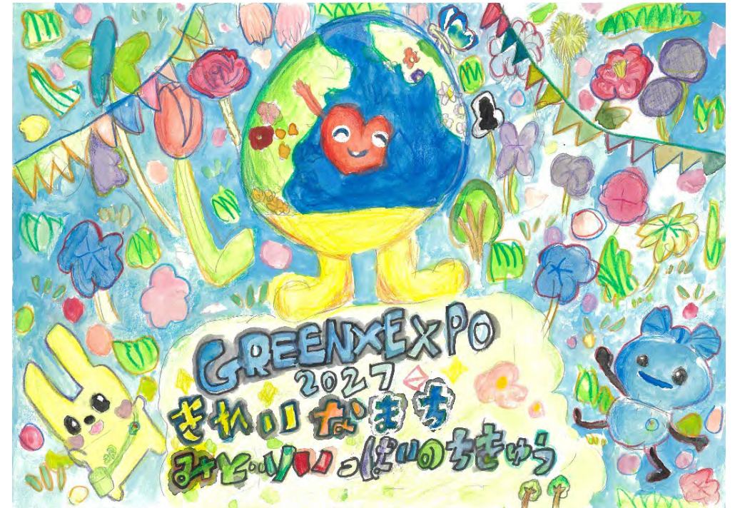
令和7年度【特別賞】GREEN×EXPO 2027賞作品