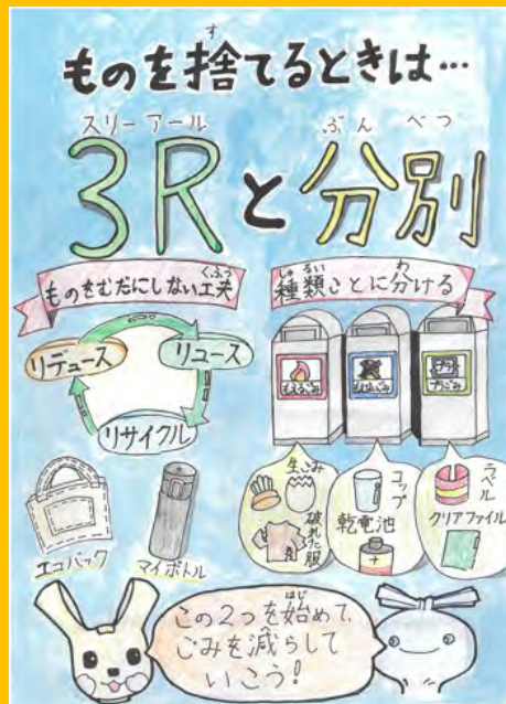
令和7年度 準大賞作品（小学校高学年の部）