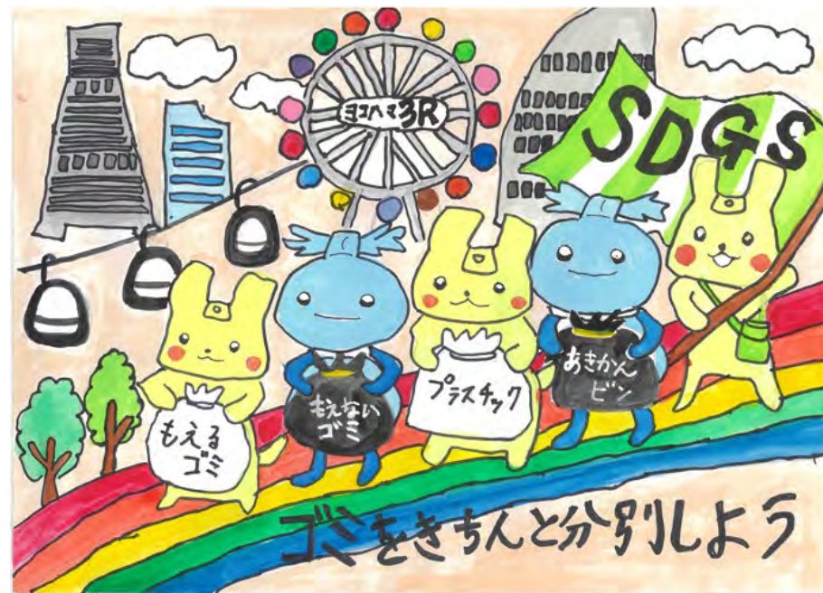
令和7年度 準大賞作品(小学校低学年の部)