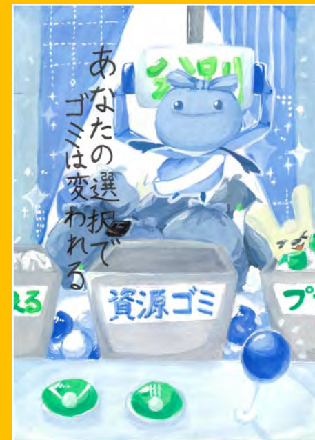
令和7年度 準大賞作品（中学生の部）