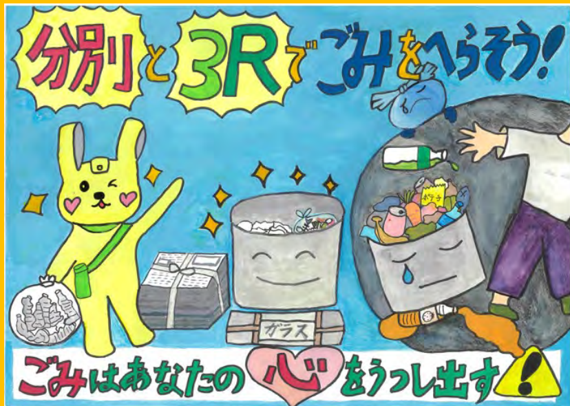
令和7年度 大賞作品(小学校高学年の部)

令和8年度ポスターコンクールに御賛同いただける企業様からの御支援をお待ちしております。 御協賛いただける企業様には、特典メニューを御用意しております。詳細については、次ページ以降をご覧ください。