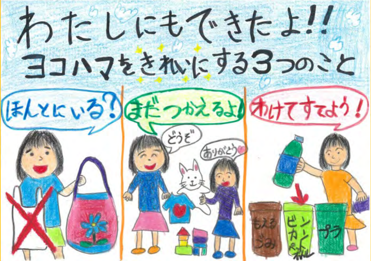
令和7年度 大賞作品 (小学校低学年の部)