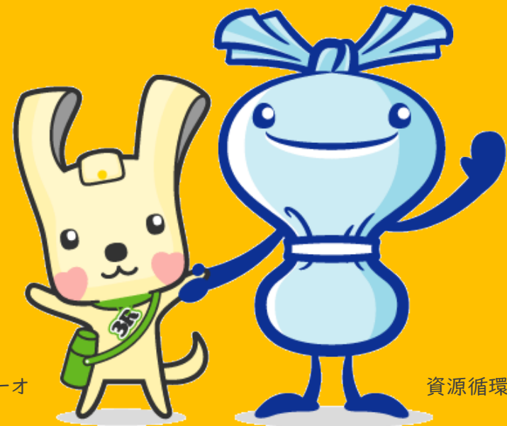
資源循環局マスコットイーオ