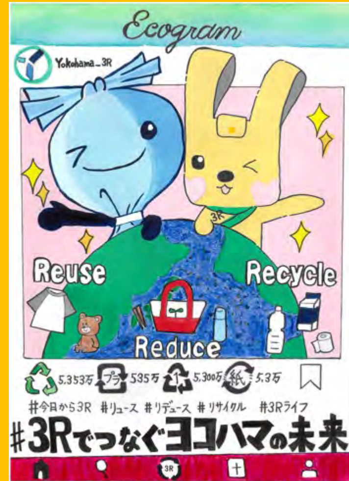
令和7年度 準大賞作品(中学生の部)