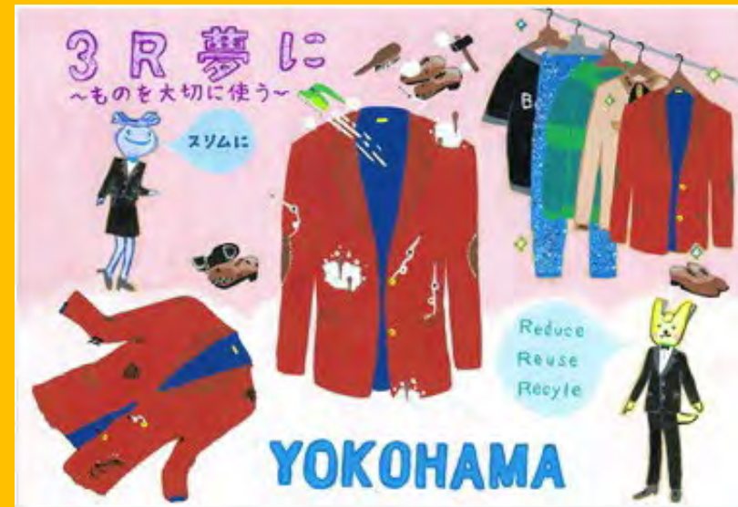
令和5年度 準大賞作品（中学生の部）