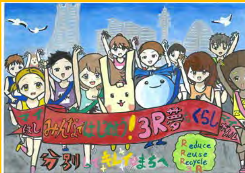
令和5年度 大賞作品 (小学校高学年の部)