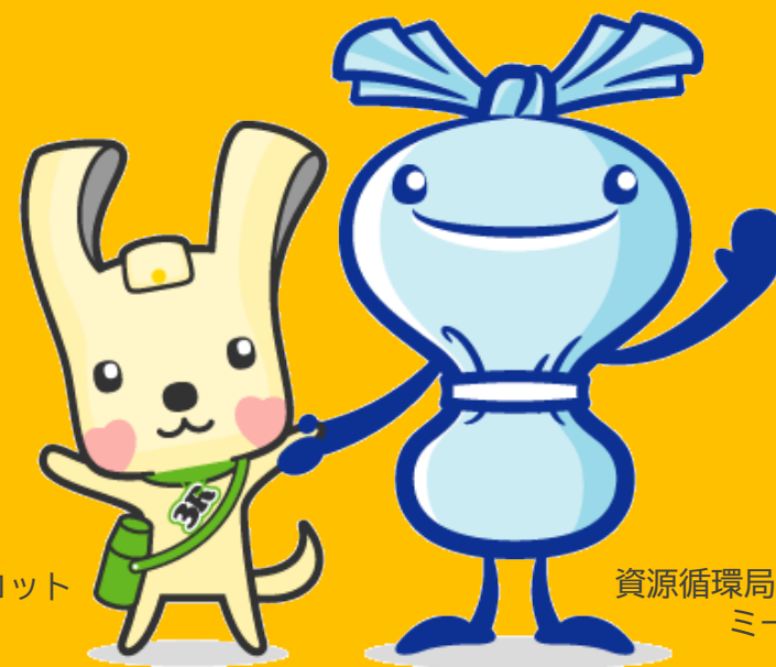
資源循環局マスコット イーオ