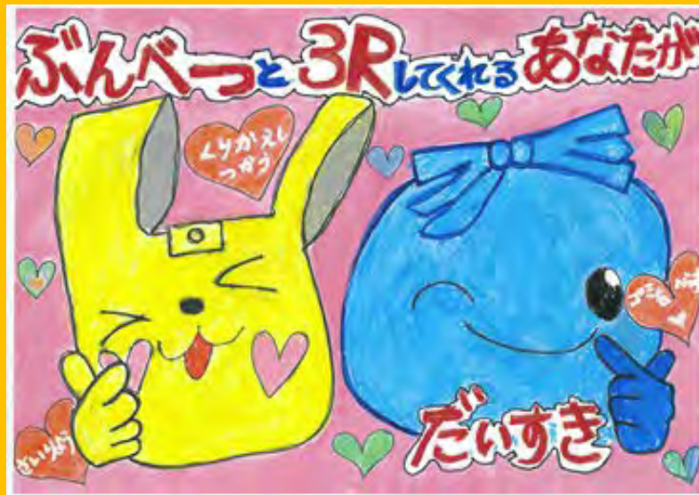
令和5年度 準大賞作品（小学校低学年の部）