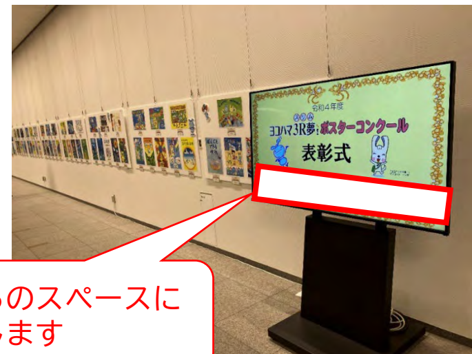
【作品展示イメージ】