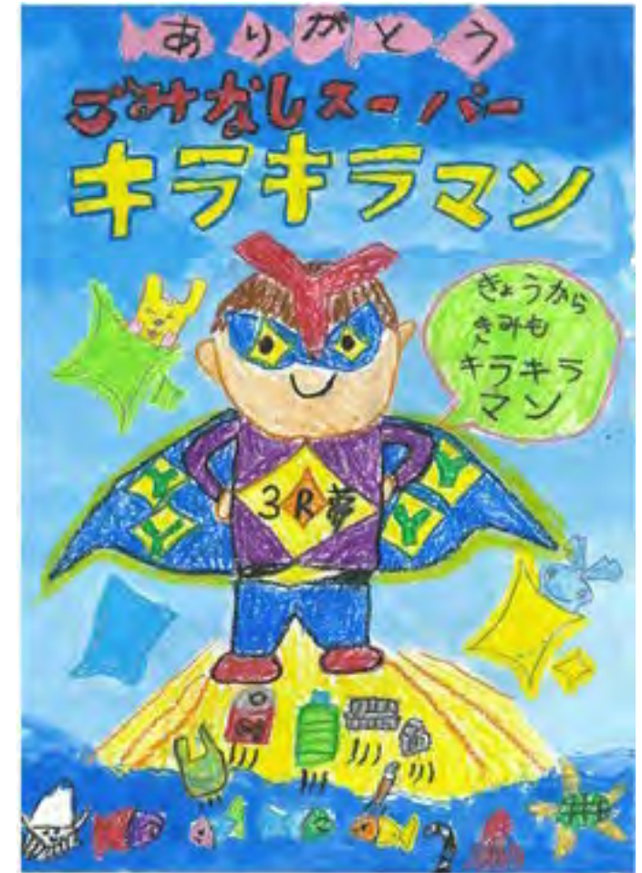
令和5年度 準大賞作品（小学校低学年の部）