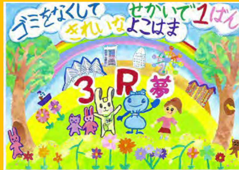
令和5年度 大賞作品（小学校低学年の部）

～横浜の子ども達に環境意識の醸成を目的に開催しております。本コンクールにぜひお力添えいただきたく 御案内申し上げます～