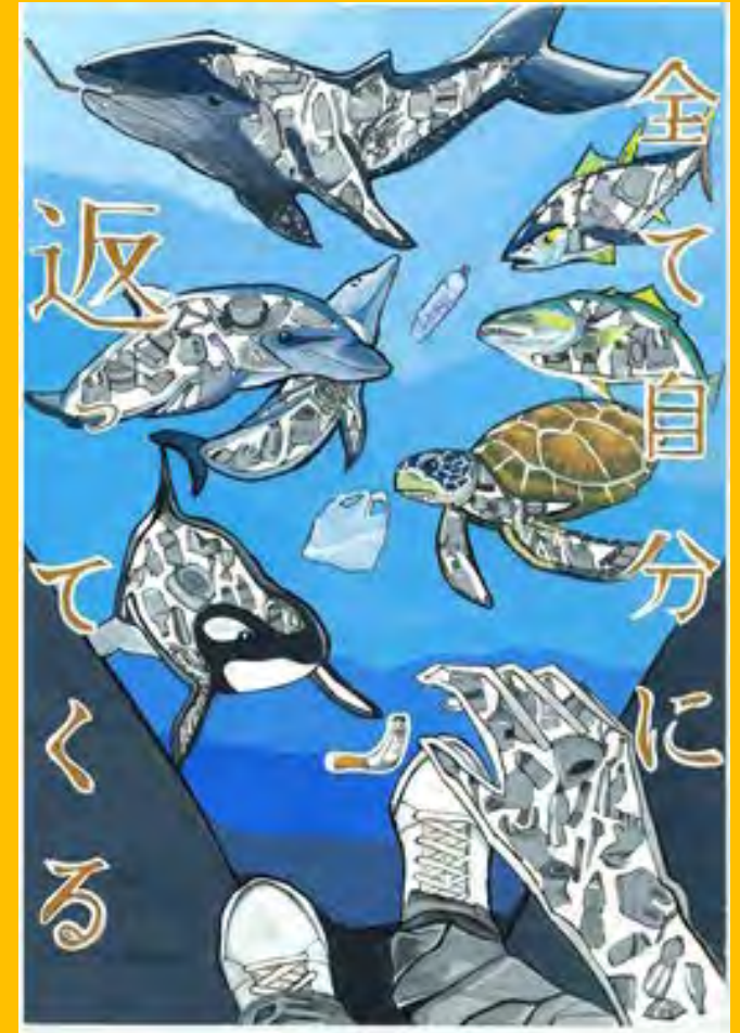
令和5年度 準大賞作品（中学生の部）