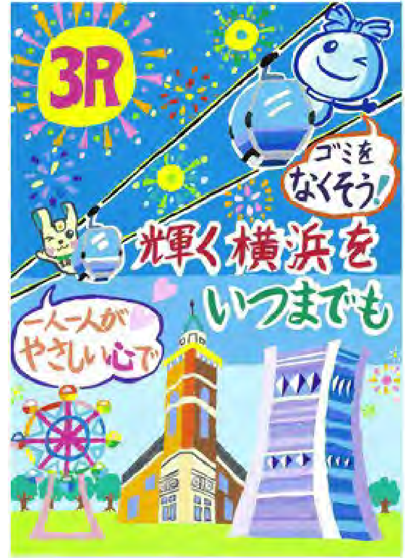
令和5年度 準大賞作品（小学校高学年の部）

URL https://www.city.yokohama.lg.jp/kurashi/sumaikurashi/gomi-recycle/gakushu/posucon/posucon-gaiyou.html