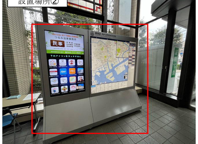
設置場所② モニター2面 床置き・自立式