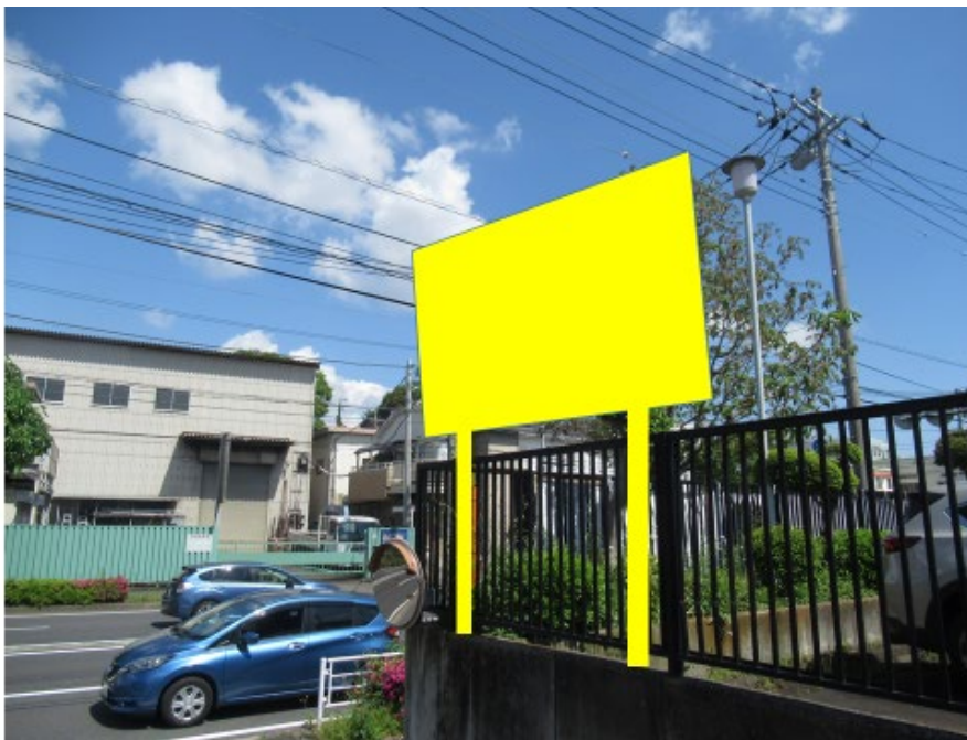
中原街道沿い敷地内フェンス上部