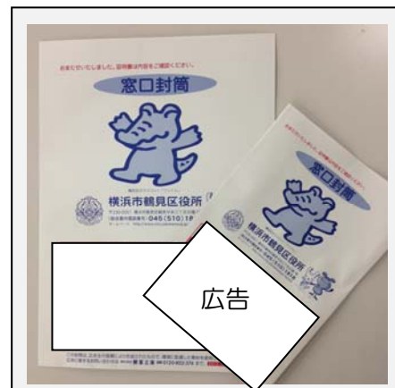
【角6号相当(右)、角2号相当】