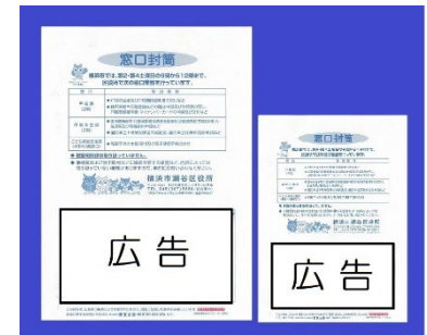
【角6号相当(右)、角2号相当】