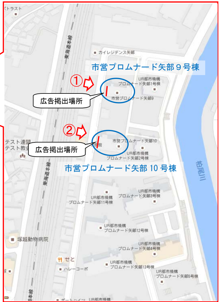
▲市営プロムナード矢部 位置図