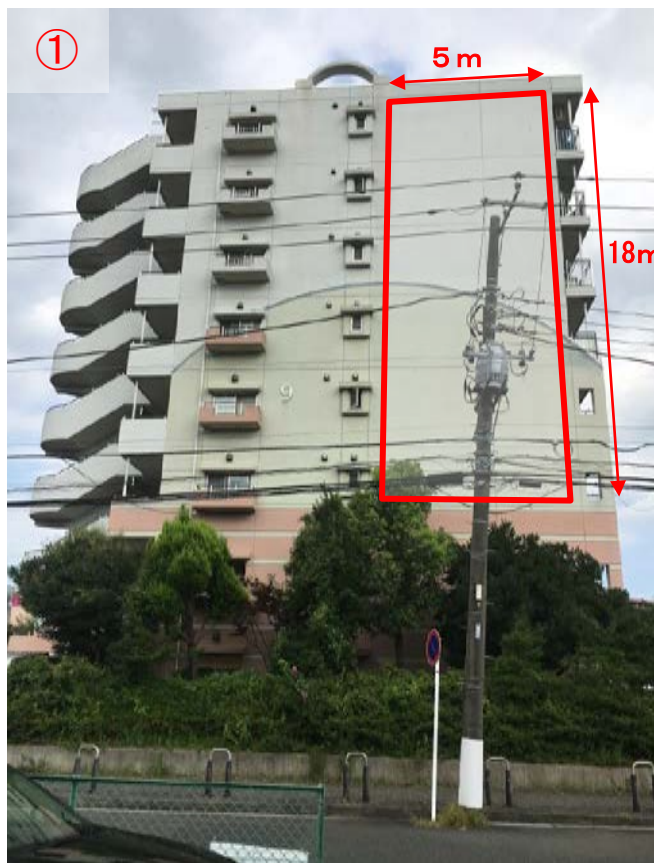
▲市営プロムナード矢部 9号棟 外観