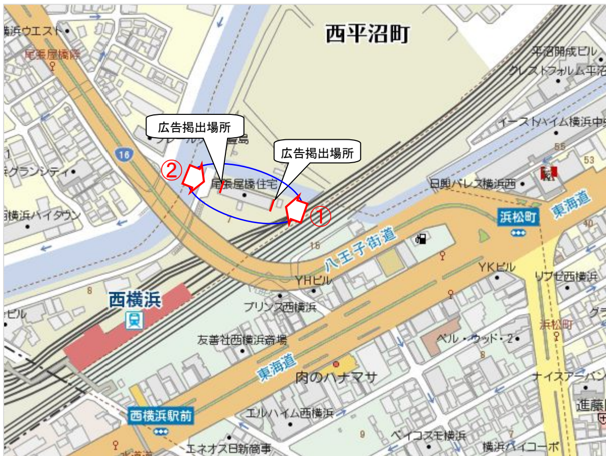
▲市営尾張屋橋住宅 位置図