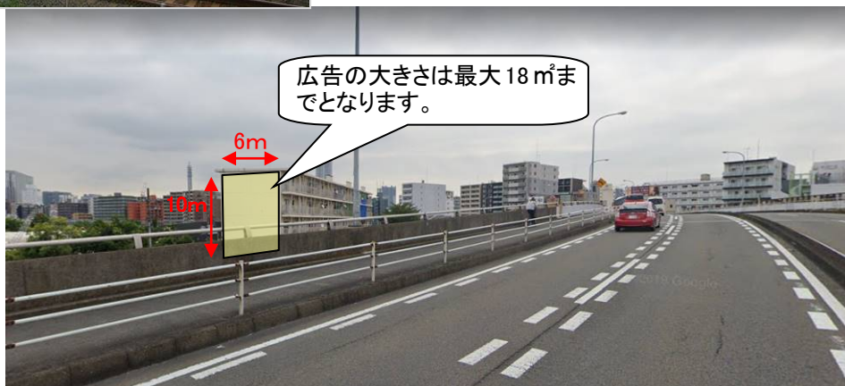
▼市営尾張屋橋住宅 外観②