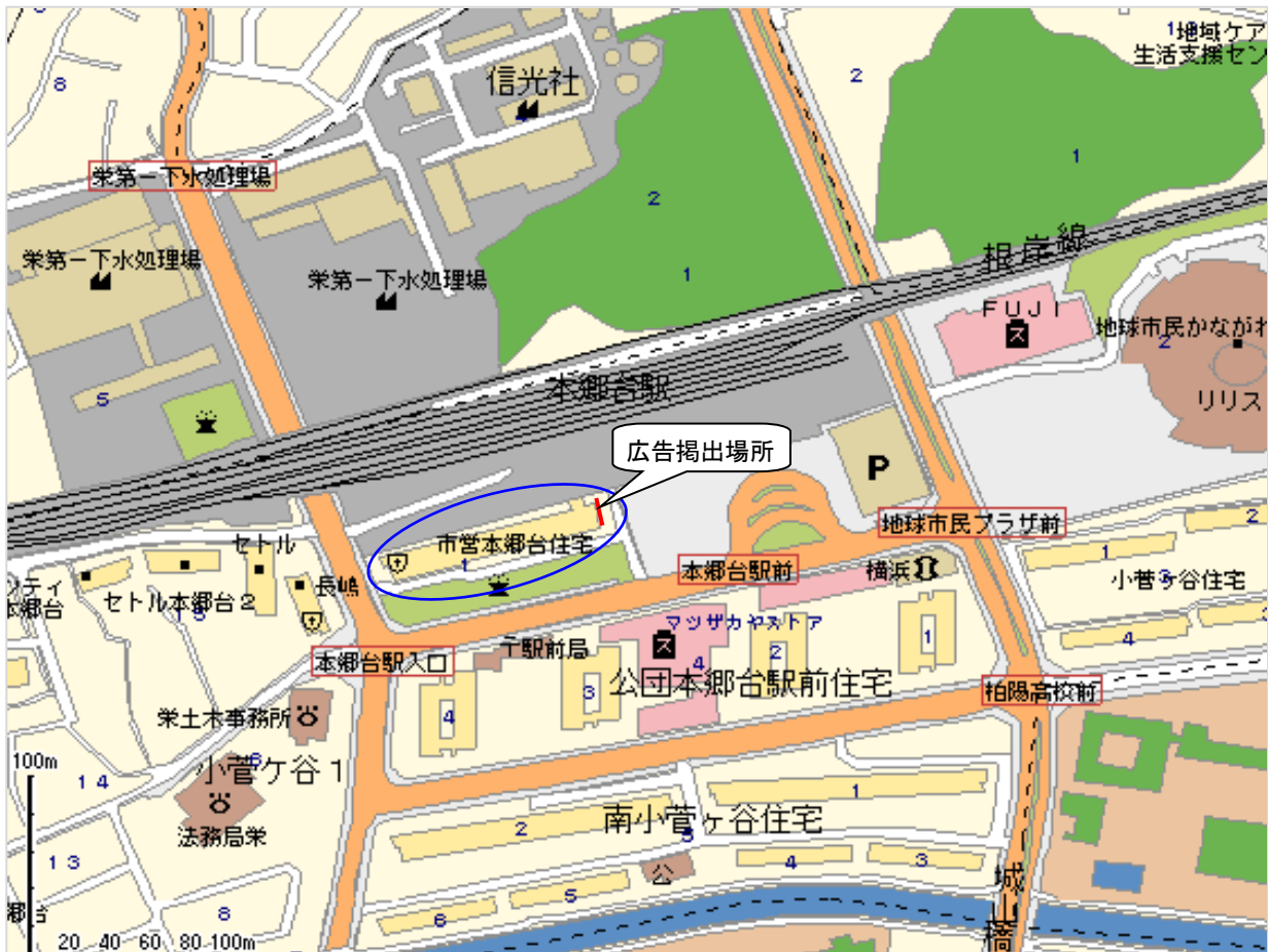
▲市営本郷台住宅 位置図