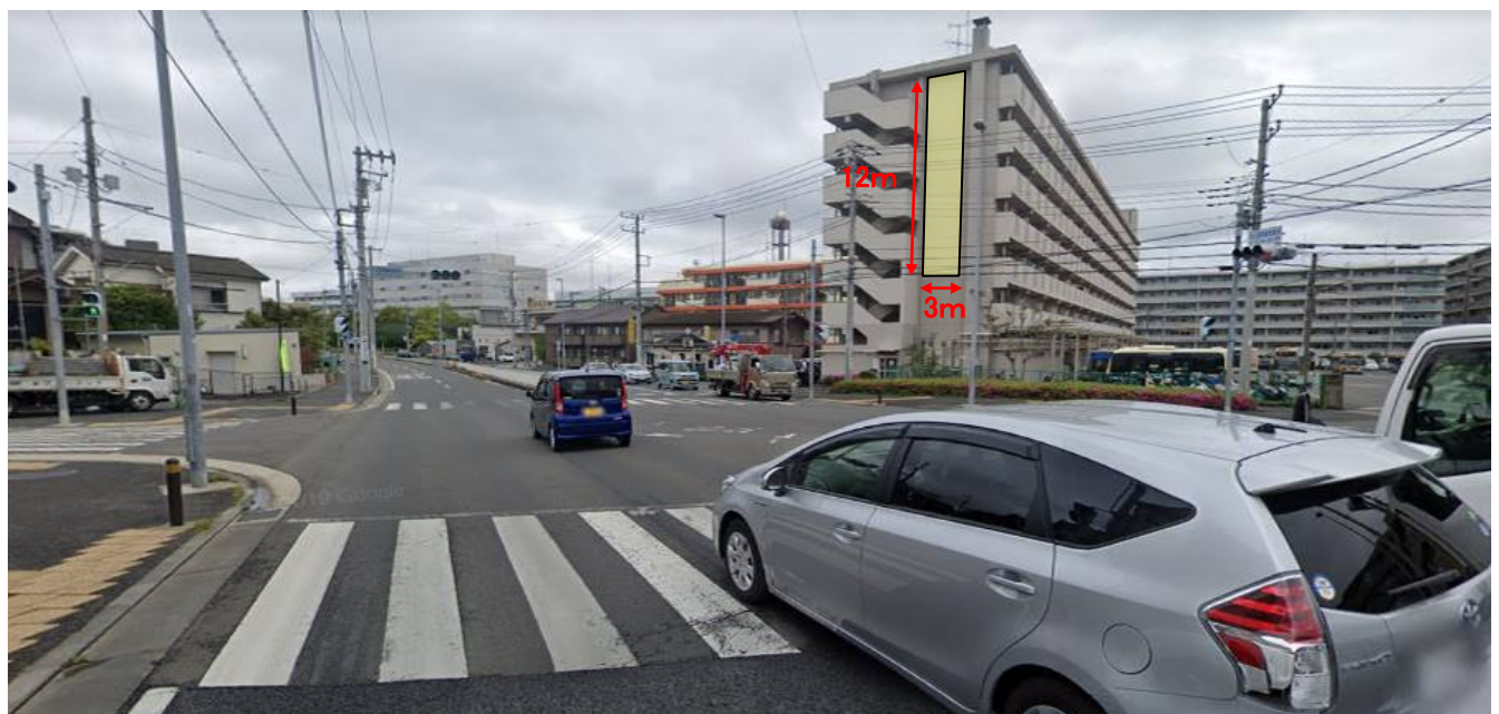
▲市営白山住宅 外観