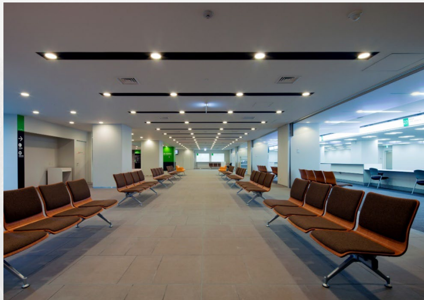
瀬谷区総合庁舎内観