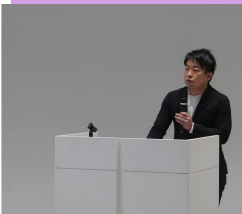
アクセンチュア(株) 福井様

アクセンチュアの企業市民活動は、2010年より “Skills to Succeed”という共通テーマで推進されています。 2024年度で世界各地の434.4万人の人々に対して、 日本においては12.8万人の人々に就業や起業のための スキル構築の機会を提供しました。 今後さらに多くの人々への支援を拡大していけるよう推進していきます。