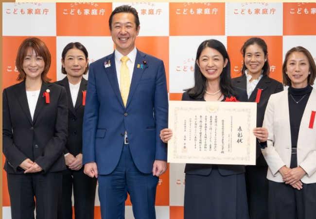
こまちぷらす様の取り組みが令和7年度「未来をつくるこどもまんなかアワード」内閣総理大臣表彰を受賞しました