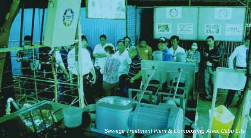
Sewage Treatment Plant & Composting Area, Cebu City