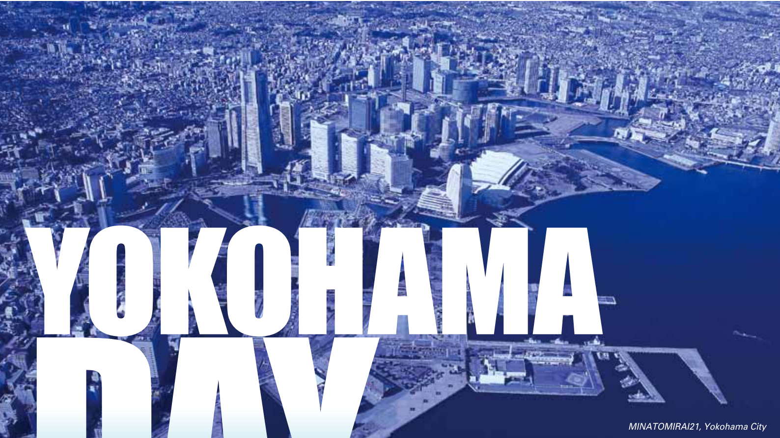
MINATOMIRAI21, Yokohama City