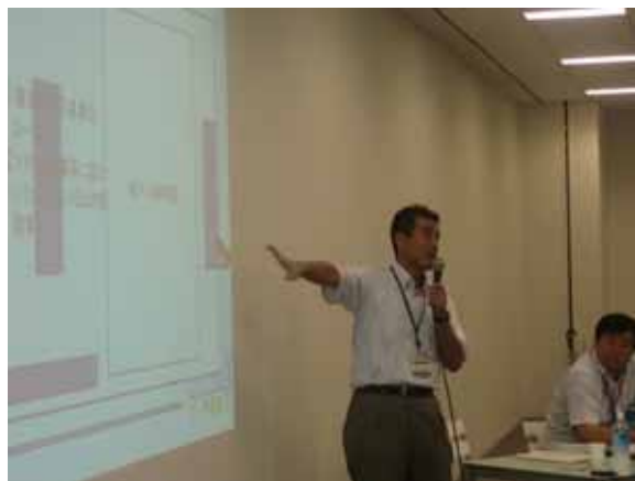
横浜市からの情報提供