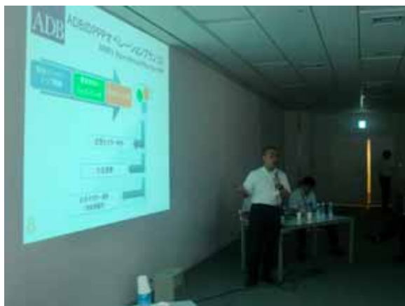
アジア開発銀行の講演