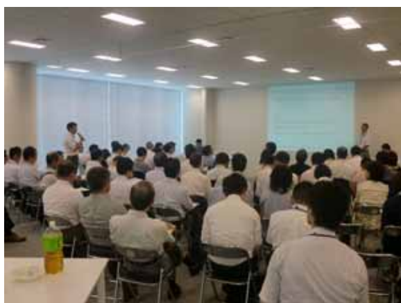
参加者との意見交換