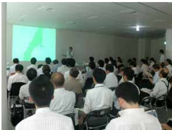
横浜市からの情報提供