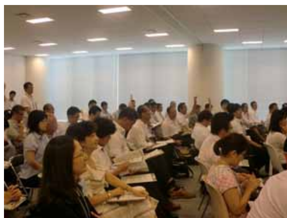
参加者との意見交換