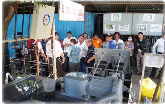
JICAの中小企業海外展開支援事業を活用した セブ市における汚泥脱水装置のデモンストレーション (株アムコン)

Y-PORT YOKOHAMA PARTNERSHIP OF RESOURCES AND TECHNOLOGIES