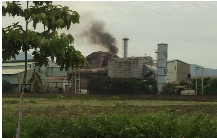
ベトナム社会主義共和国ダナン市内ホアカイン工業団地