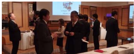
〈名刺交換会の様子〉