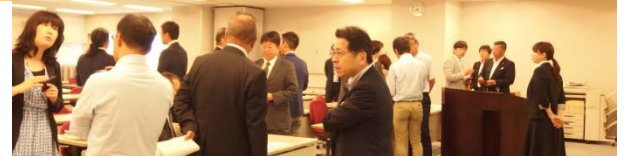
<名刺交換会の様子>