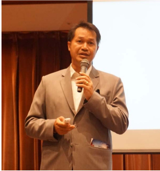
<エネルギー省 タワラット局長>