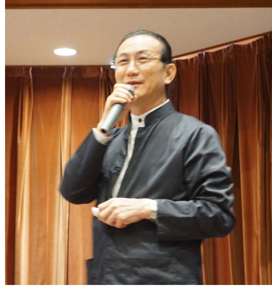
<アマタ社 ウィクロムCEO>