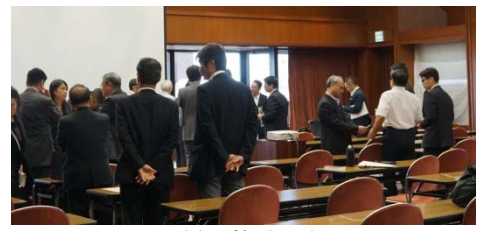
<名刺交換会の様子>