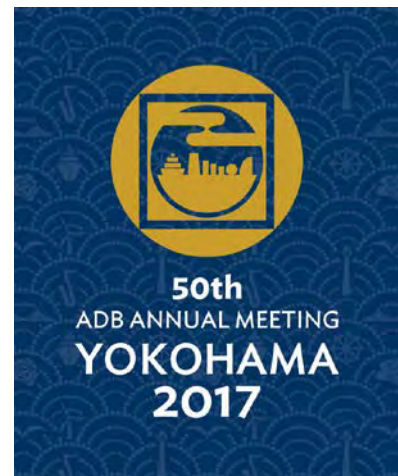
第50回年次総会のロゴ