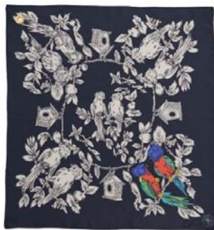
「Bird」 / S36年/ナイジェリア

YOKOHAMA SCARF サイズ約 52×52 cm 日本製 (写真下：商品名/年代/当時の仕向け地)