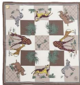
「Safari」 / S32年/アフリカ詳細不明