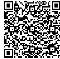
実績報告フォーム QRコード