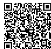
省エネ診断受診コース WEB ページ