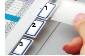
【インデックスのイメージ】