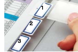
【インデックスのイメージ】