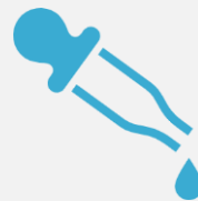
尿検査 (年1回) ※3歳以上の児童