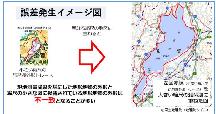
図2 精度誤差発生イメージ図

さらに、地形図は航空写真から作成されており、現地調査を経て作成されている道路台帳図（区域線図）及び境界調査図とはその成り立ちからして異なることも、原因の一つとなっています。（図3）