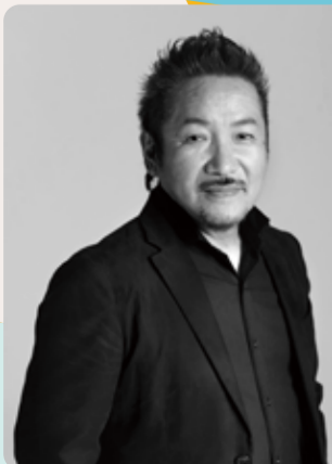
写真家 森 日出夫

横浜市生まれ。JPS(日本写真家協会)所属。長年撮り続けた横浜の港・街・人を「森の観測」と名づけ、独自の感性で森の「記憶」を記録する。ニューヨークADC MERIT AWARD受賞。第50回横浜文化賞奨励賞受賞。写真集「YOKOHAMA PASS ハマのメリーさん」刊行。写真集「SCENERY of Yokohama」1~3 刊行 他。