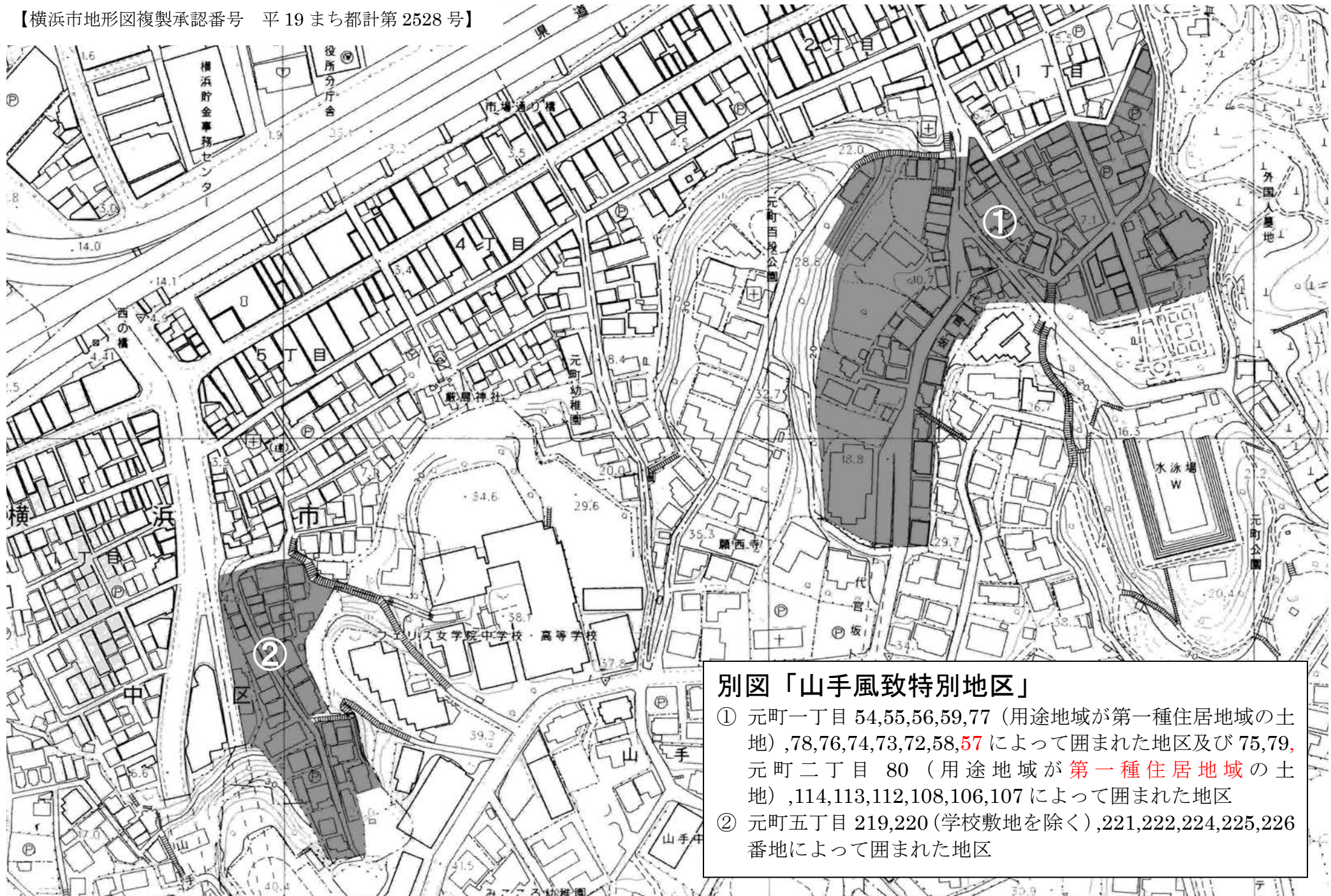
別図「山手風致特別地区」 ① 元町一丁目 54,55,56,59,77 (用途地域が第一種住居地域の土地) ,78,76,74,73,72,58,57 によって囲まれた地区及び 75,79, 元町二丁目 80 (用途地域が第一種住居地域の土地) ,114,113,112,108,106,107 によって囲まれた地区 ② 元町五丁目 219,220 (学校敷地を除く) ,221,222,224,225,226 番地によって囲まれた地区