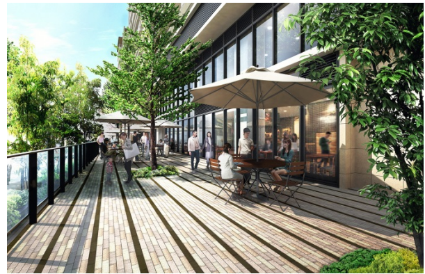
CO-NIWA たまプラーザ シェアワークスペース