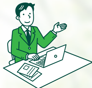
低炭素電気普及促進計画書兼報告書の提出