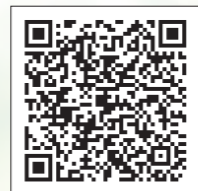
横浜市電子申請・届出システム 検索