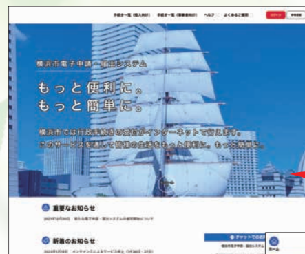
横浜市電子申請・届出システムTOPページ