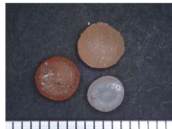
横浜市環境科学研究所の調査により野島海岸で採取された樹脂ペレット

世界的に問題となっている海洋プラスチック汚染に対応するため、横浜市生活環境の保全等に関する条例に基づき定める「環境への負荷の低減に関する指針（事業所の配慮すべき事項）」に、樹脂ペレットの漏出防止に係る取組を定めました。 樹脂ペレットを使用等する事業者の方は、指針に基づく取組の推進をお願いします。