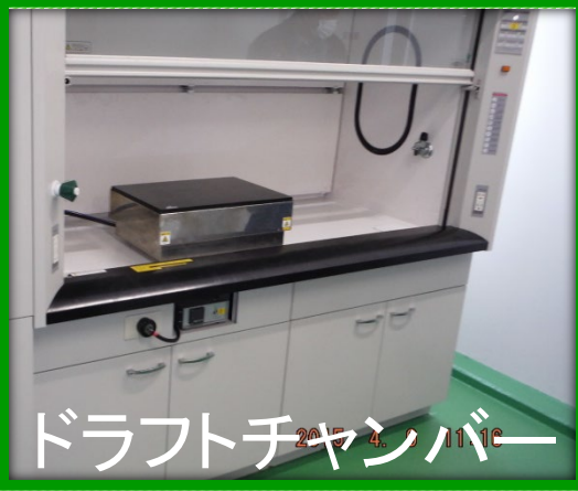
ドラフトチャンバー

研究機関で施設を設置したり、変更・廃止などをする場合、環境法令で以下のような規制がかかる可能性があります。以下の例はあくまで一例で全てを網羅しているわけではありませので、詳しくは裏面に記載の各法令所管課担当にご相談下さい。