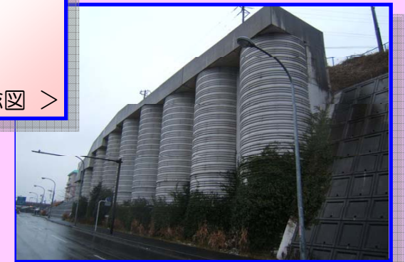
< 深礎よう壁の設置事例 >