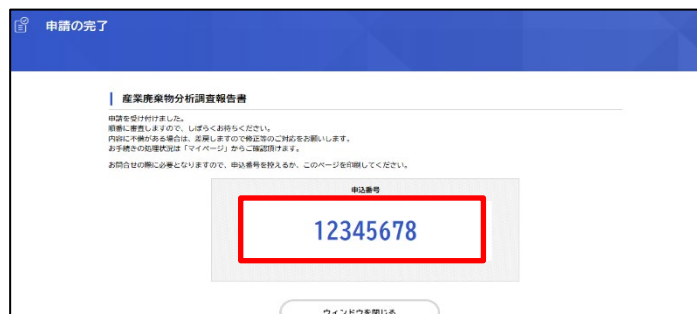
電子申請完了後に表示される画面