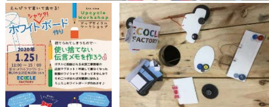
アップサイクル品(例)