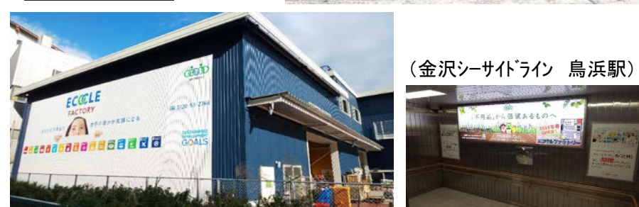
(金沢シーサイドライン 鳥浜駅)