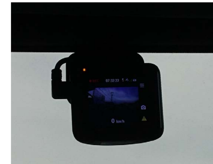
全車両のドライブレコーダー装着