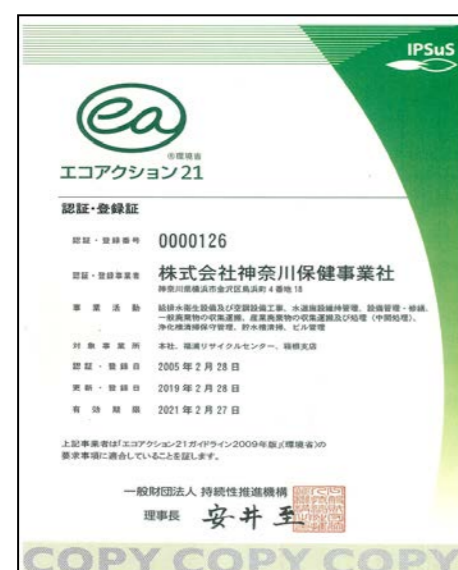
エコアクション21認定証