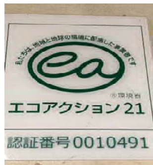
エコアクション21に取り組んでいる