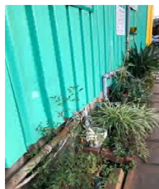
近隣の清掃作業を定期的に行っている