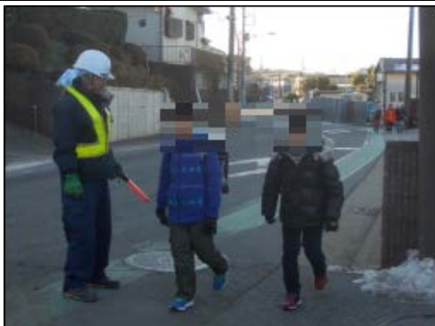
※新井小学校通学路での安全歩行誘導活動風景