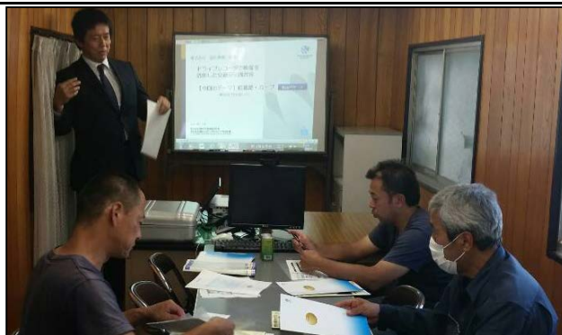
※ドライブレコーダー使用後の安全運転反省会