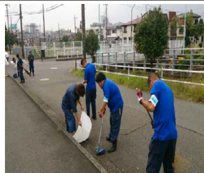
<地域美化活動の参加>