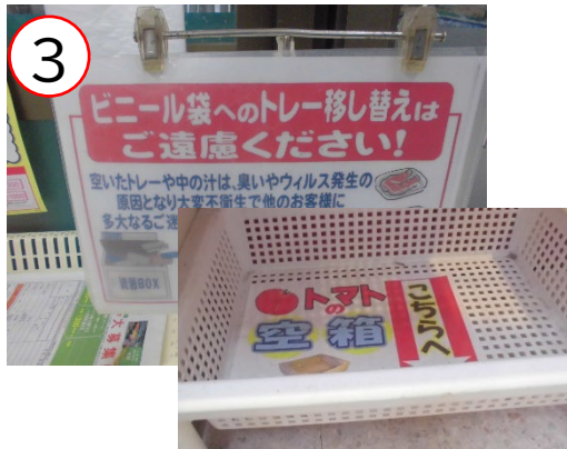
トレー・空箱は リサイクル可能な状態で回収