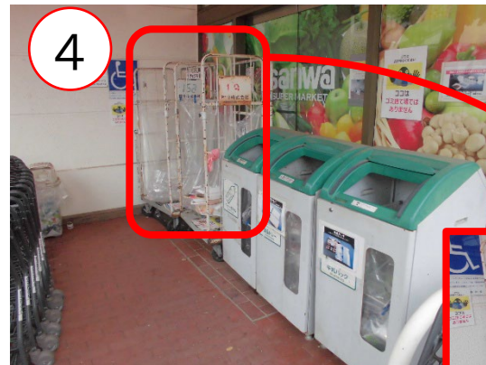
リサイクル品回収拠点