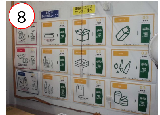
廃棄物の種類、行先の明示