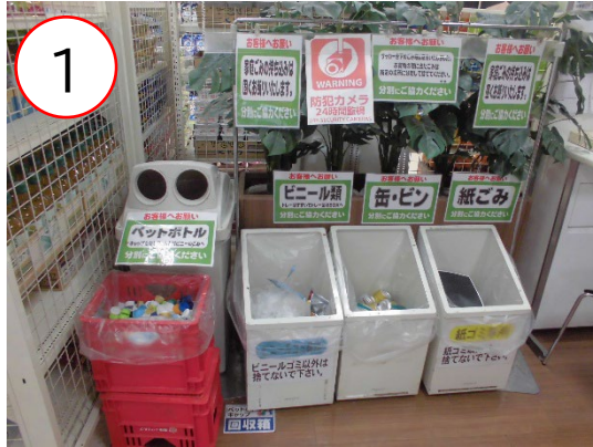
大きく品目表示のされたごみ箱