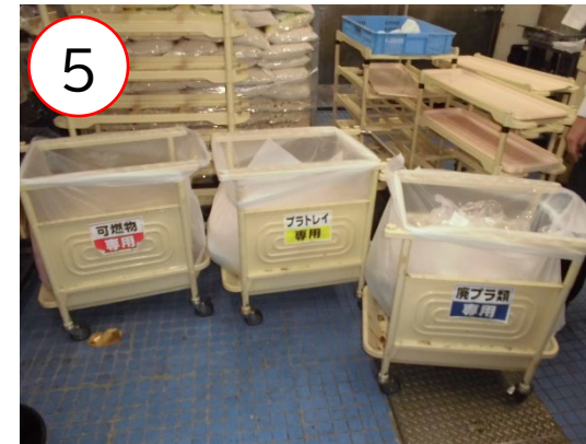
種類別に大きく品目表示のされた ごみ箱