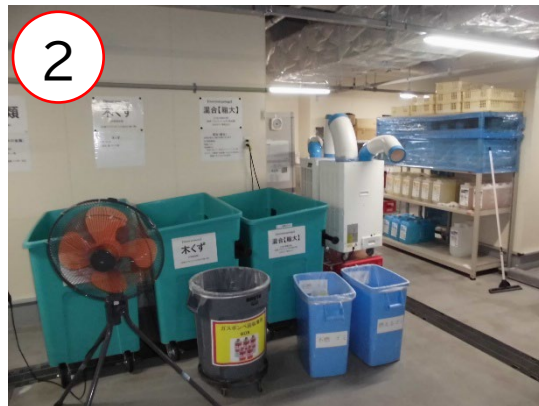
2 細かく品目明示がされている