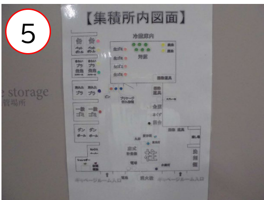
5 シールで色分けした置場設置図