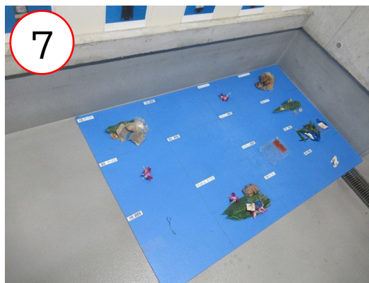
7 どこから出たごみが間違っ分別されているのかを示すボード