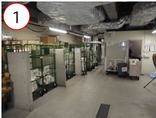
1 清掃の行き届いた廃棄物保管場所