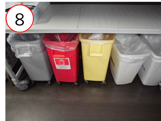
8 客室や宴会場から集められたごみは一時保管場所にて細かく分別がされる