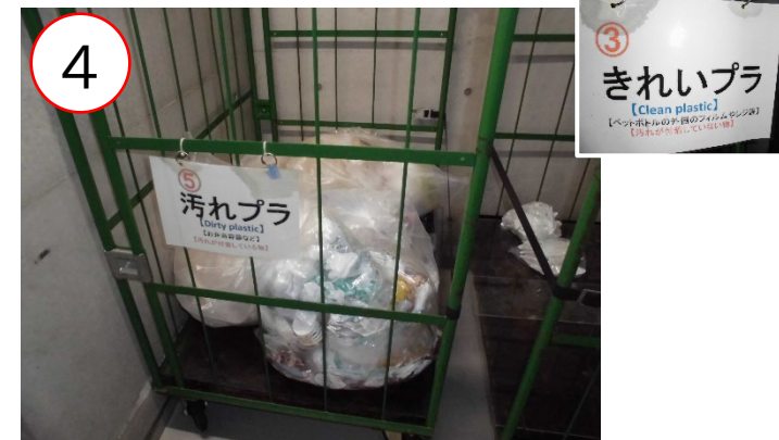
4 2種類に分けられているプラスチック類