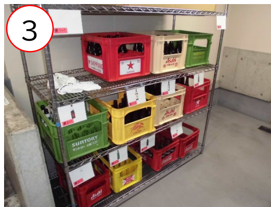
3 種類別に分けたびん類置場