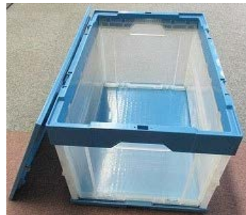
配送用リユースケース