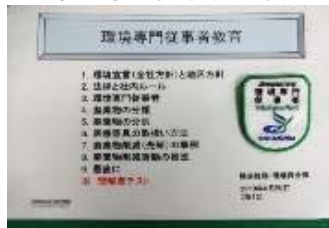
環境専門従事者制度